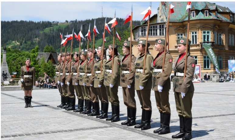
fol. M. Sokółowski