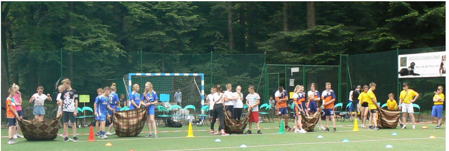
fol. ZSP Rymanów Zdrój